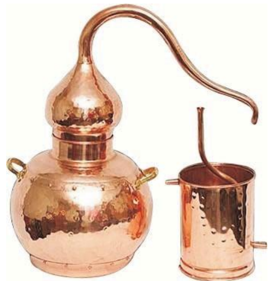
Фото 2. Аламбик без колонны